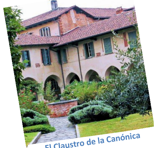
El Claustro de la Canónica