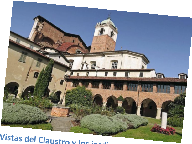
Vistas del Claustro y los jardines de la Canónica