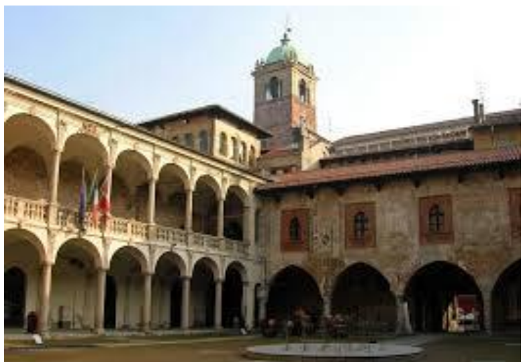
El patio del Broletto

Habitualmente se trata de edificios del siglo XIV, con arcos de medio punto o apuntados, según la época, y contruidos en piedra o ladrillos, según la zona. Tienen dos plantas: la inferior, que suele ser un pórtico abierto donde se celebraban asambleas del pueblo o el mercado, y la superior, donde hay amplias estancias con ventanas grandes donde se celebraban los consejos municipales o donde daban audiencia los jueces.