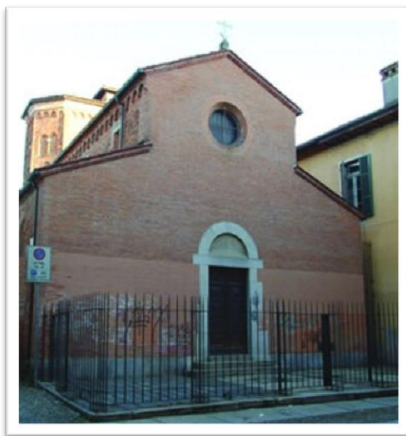
Fachada principal de la Iglesia de Ognissanti

La antigua Iglesia de Ognissanti (Todos los Santos) surge en la esquina del Vicolo Ognissanti y la Via Silvio Pellico , en el casco antiguo de la ciudad. Sus orígenes son remotas, ya es recordada en 1124, en la época de Litifredo, entre las iglesias ciudadanas cuyo clero era exhonerado de ir a la Catedral para las oraciones de la mañana durante las principales fiestas. Posteriormente, se cita en 1132 entre los bienes confirmados al Obispo por el Papa Inocencio II. El edificio consta de (tres naves de cuatro arcadas cada una, con ábside semicircular. La iglesia es dotada de un elegante cimborrio