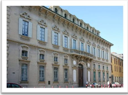
Fachada del Palacio Tornielli Bellini

En 1525, empezó en Novara la dominación española. Muchos edificios fueron derrumbados para facilitar la construcción de murallas defensivas que ocupaban el sitio de los actuales Baluardi . En dos siglos de dominación, los españoles dejaron huellas profundas en el aspecto de la ciudad.