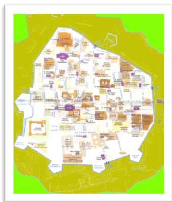
Novara en las antiguas murallas

octogonal iluminado por ventanas y ajimeces . En el interior son visibles algunos frescos , entre los cuales una “ Virgen de la Leche” atribuida, por la crítica, a Giovanni de Campo, que se remonta a mediados del siglo XV. Exteriormente, la mampostería del edificio es de ladrillos dispuestos en líneas regulares, elegantes pequeños arcos colgantes que apoyan sobre pequeñas repisas variamente decoradas con terracota, que decoran la parte debajo del canalón . Durante los años cincuenta del siglo XX, el antiguo edificio